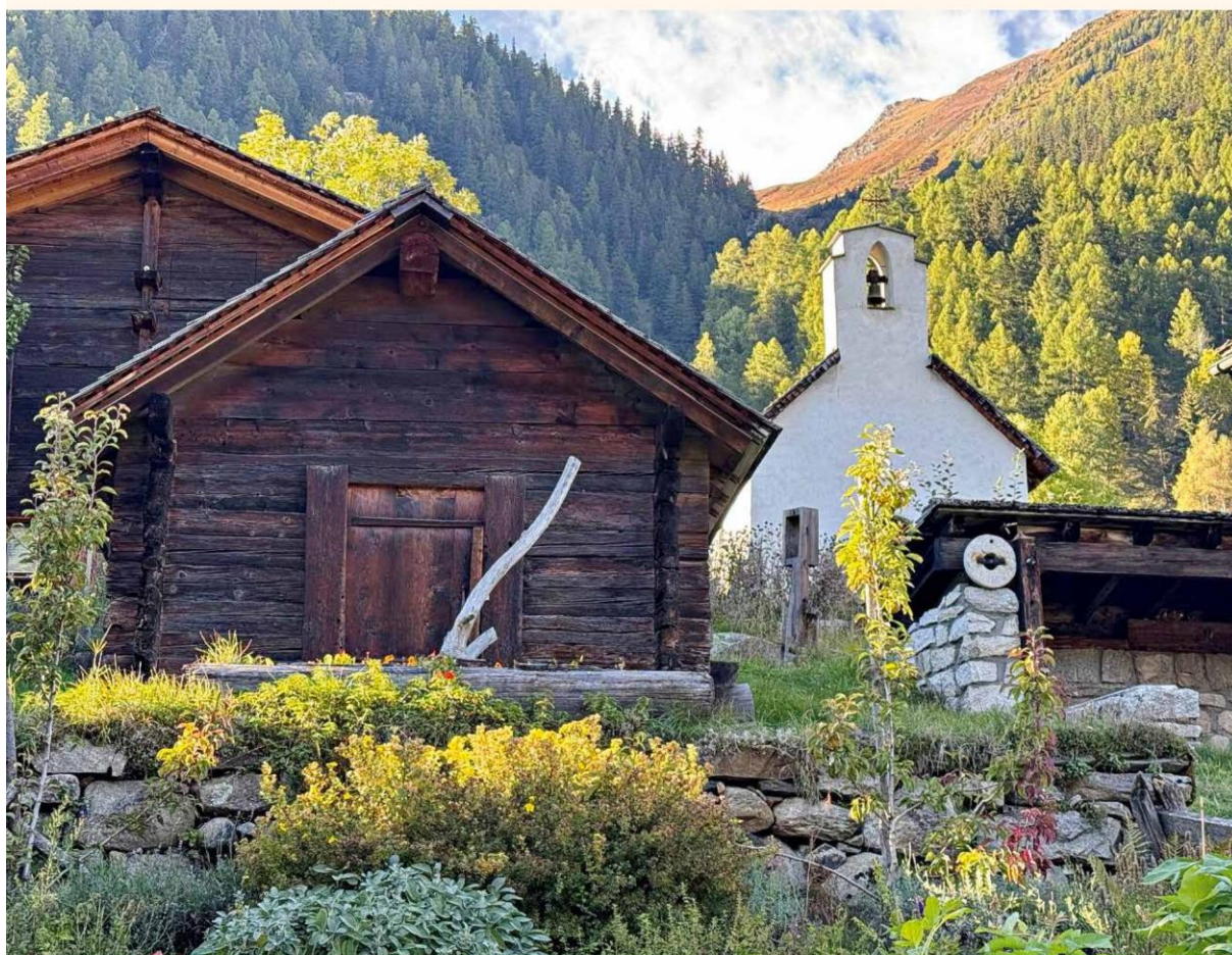
Wiler: St. Andreas-Kapelle